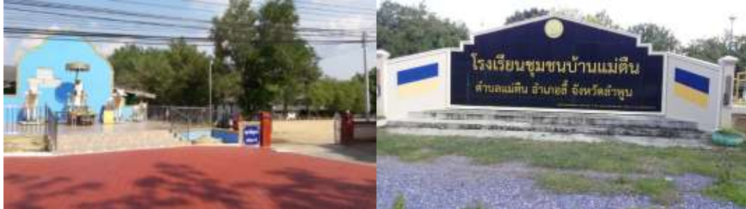
ข้อมูลจากโรงเรียนชุมชนบ้านแม่ต๋น (ณ วันที่ 14 มิถุนายน 2564) ระดับมัธยมศึกษา โรงเรียนแม่ต๋นวิทยา ตำบลแม่ต๋น อำเภอลี้ จังหวัดลำพูน