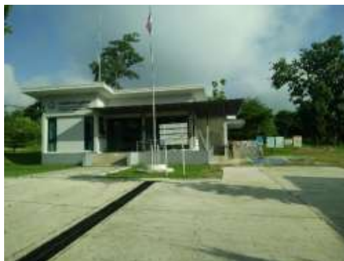
(ข้อมูล การไฟฟ้าสาขาย่อยแม่ตื่น (อำเภอลี่) ณ วันที่ 6 ตุลาคม 2564)