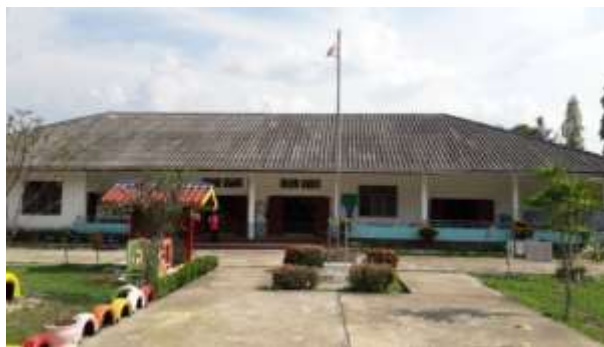
(ข้อมูล กองการศึกษา เทศบาลตำบลแม่ตื่น ณ วันที่ 6 ตุลาคม 2564)

โรงเรียนในสังกัดสำนักงานคณะกรรมการการศึกษาขั้นพื้นฐาน จำนวน 1 โรงเรียน ได้แก่โรงเรียนชุมชนบ้านแม่ตื่น ตำบลแม่ตื่น อำเภอลี้ จังหวัดลำพูน